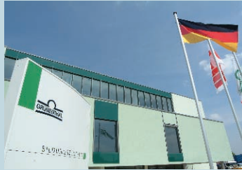
Grünenthal Bildungszentrum Zieglerstraße 1 (Ecke Neuenhofstraße) 52078 Aachen www.bildungszentrum-grunenthal.de